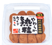
中田食品 「やわらか熟粒」