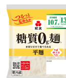
紀文 「糖質0g麺 平麺」