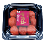
中田食品 「豊熟梅 しそ風味」